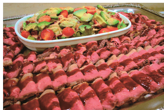
※お料理は実際の内容とは異なる場合がございます